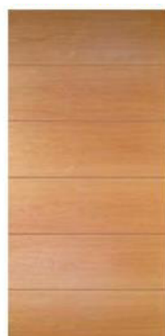
Modelo Milano 5 Canterías