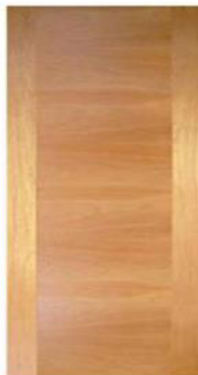
Modelo Paño Armado