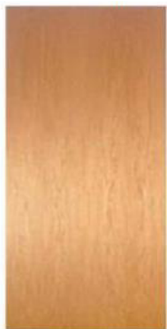
Modelo Lisa Vertical