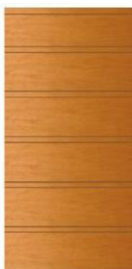
Modelo Milano Doble Cantería